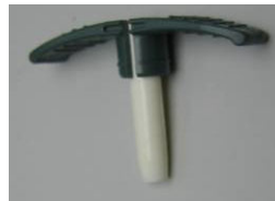
Figure 1. Outil d'ITV 11 Fr .